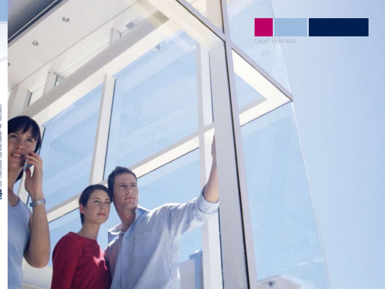
Cegid 1/2008 - Ref: 95FP08437